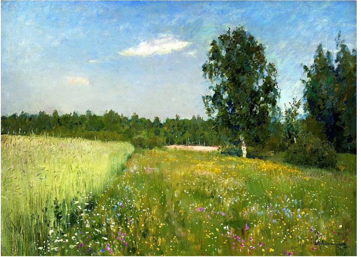
Исаак Левитан Лето