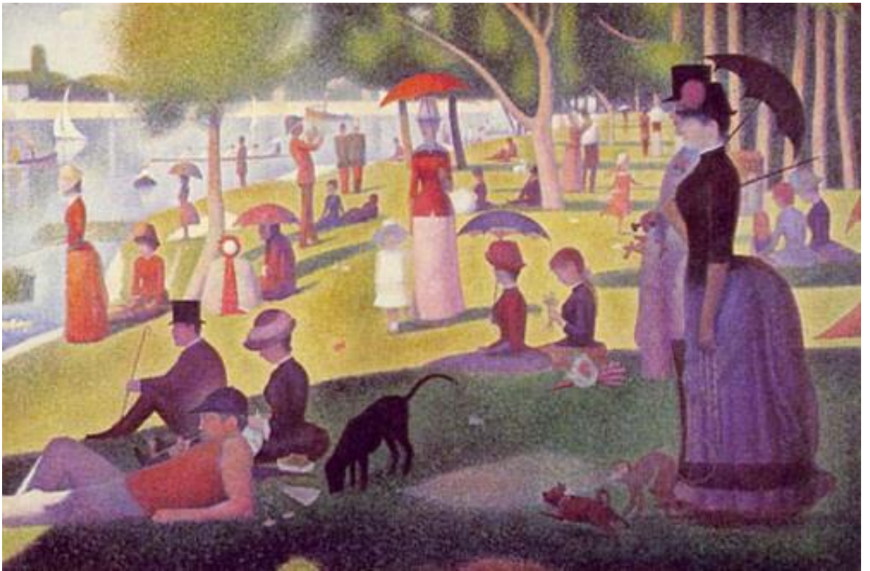
Жорж Сёра Воскресный день на острове Гранд-Жатт, 1884-1886