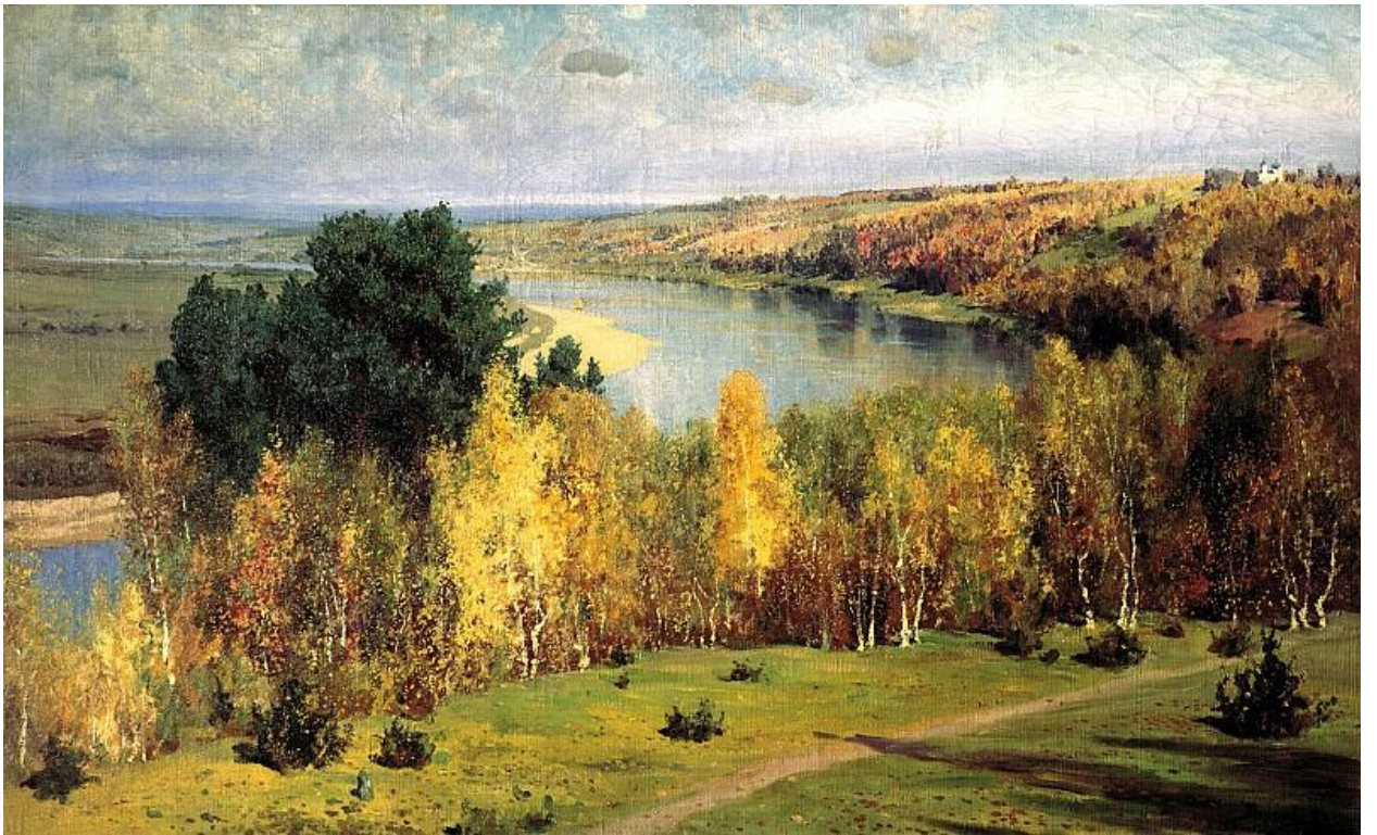
Василий Поленов Золотая осень