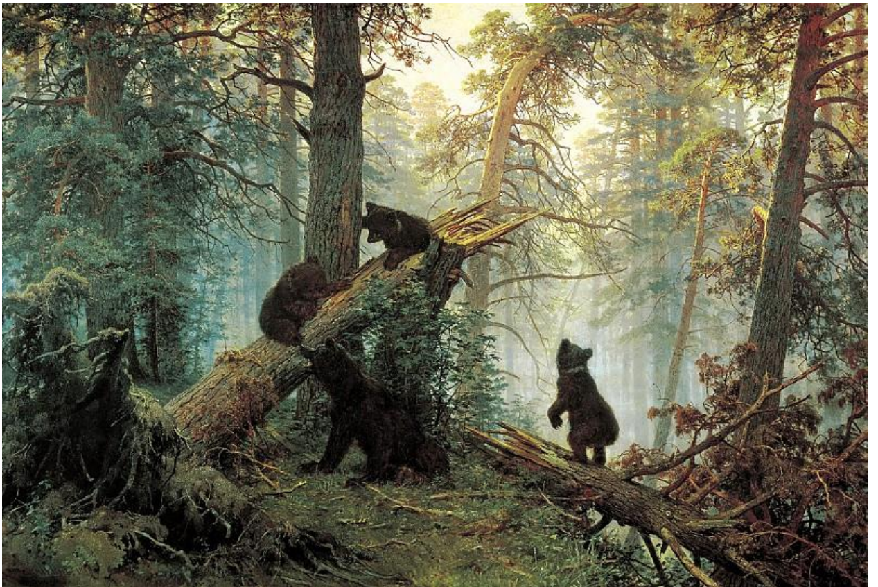
Иван Шишкин Утро в сосновом лесу