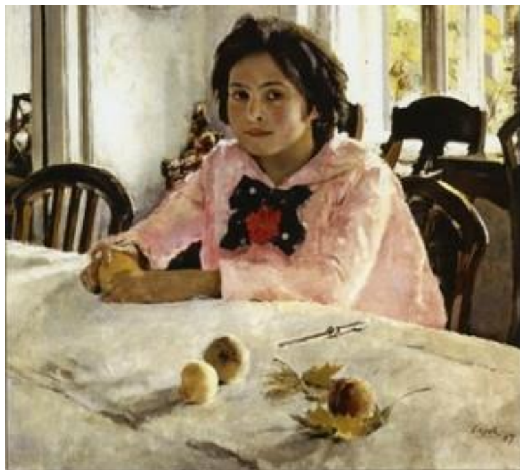
Валентин Серов Девочка с персиками, 1887