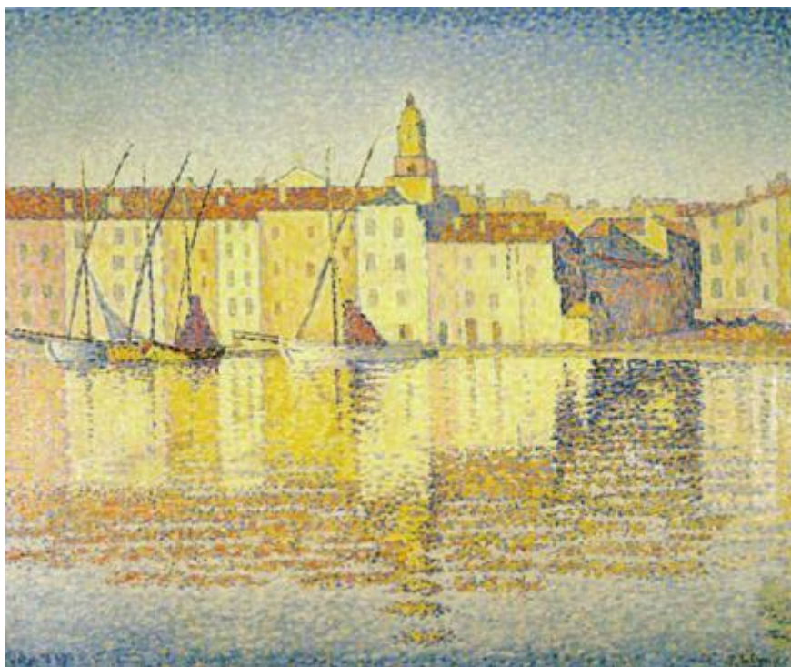
Поль Синьяк Дома в порту, Сан – Тропе, 1892