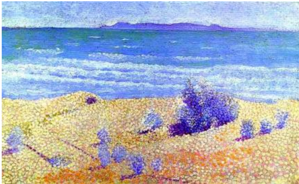
Анри Эдмон Кросс Средиземноморский пляж, 1891